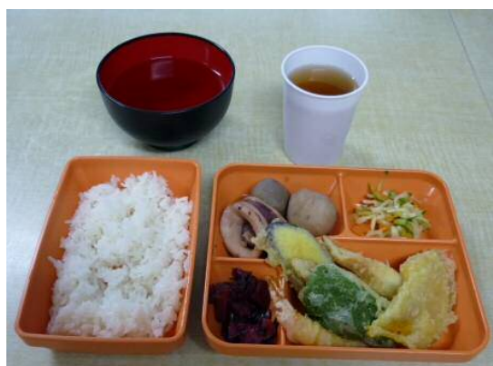
夕食は手作りのまかない。