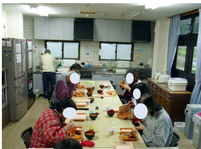
みんな食べると美味しい。