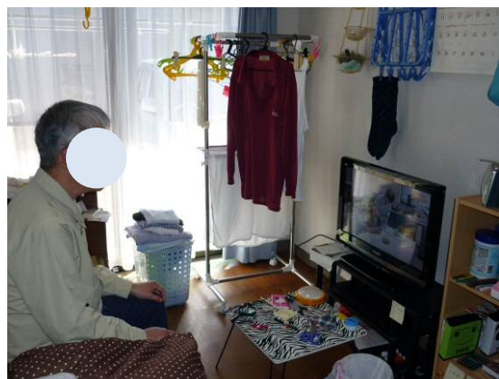
個室は好きなTVがいつでも見れる。

苦手なところをスタッフと相談しながら、 一緒に行くことで安心して暮らすことができます。