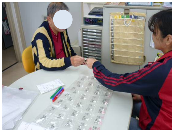
薬の飲み忘れがないように